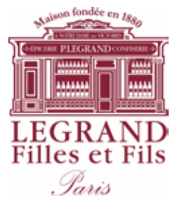
Gérard Sibourd-Baudry Legrand Filles et Fils